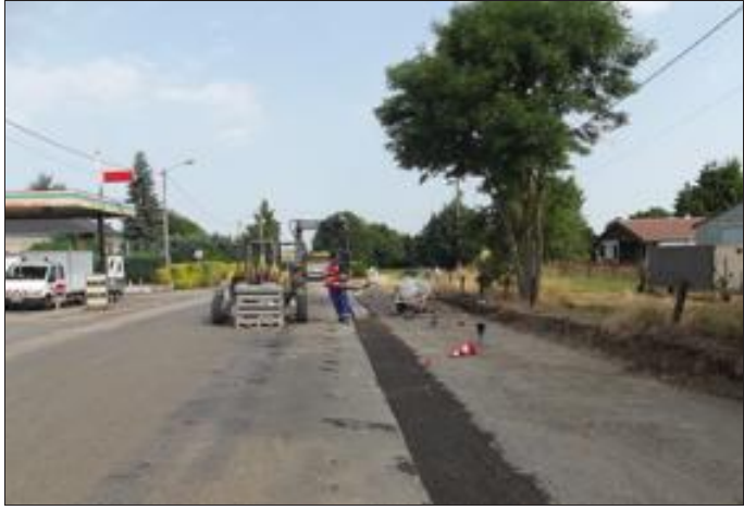
De nombreux travaux en cours dans la commune.

La société Eurovia a été retenue pour les nombreux travaux prévus à Villers-la-Montagne. Sous une chaleur assez inhabituelle, ça s'active. Sur la RN52, les engins sont en route et ronronnent dès le petit matin. Pour le confort des piétons, pour la sécurité et pour un meilleur stationnement, les trottoirs de cette très longue rue sont entièrement refaits. La municipalité en a profité pour renforcer l'emplacement des camions à l'arrêt devant la station-service. En même temps, ça bouge dans la rue du Grand-Clos : rénovation des branchements de l'eau, enterrement de l'électricité et du téléphone et rénovation de l'éclairage public (nouveaux lampadaires).