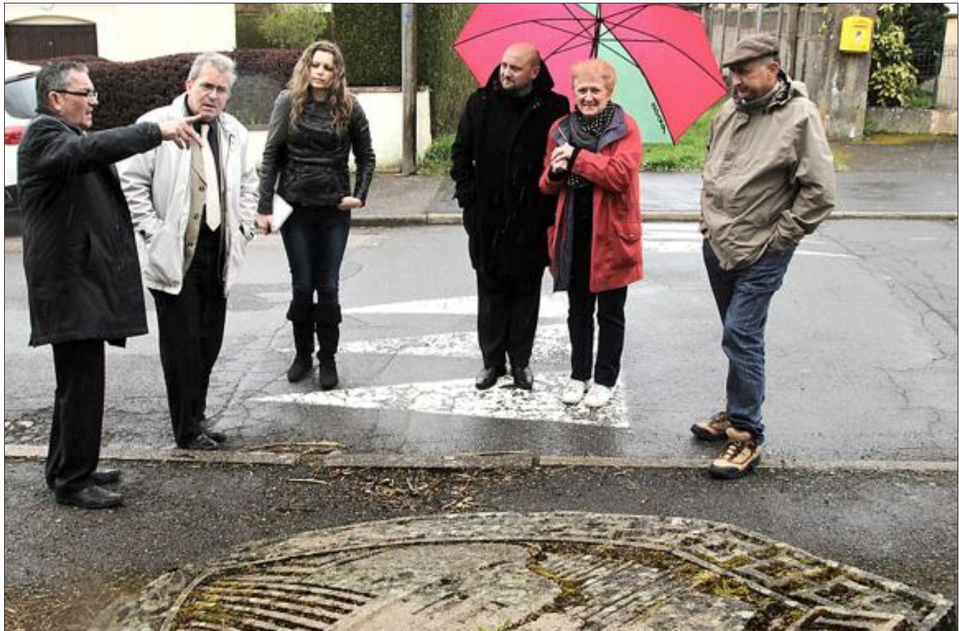
Édiles et représentants de l'office de tourisme du Pays de Longwy devant la stèle du 149 e Régiment d'infanterie à Morfontaine.

La délégation s'est ensuite rendue à Morfontaine-cité. Cet ensemble, le camp de Morfontaine, construit entre 1934 et 1938, était la garnison permanente du 2 e bataillon du 149 e Régiment d'infanterie de forteresse. L'implantation des maisons reflète la position hiérarchique de ses occupants (quartier des officiers, pour